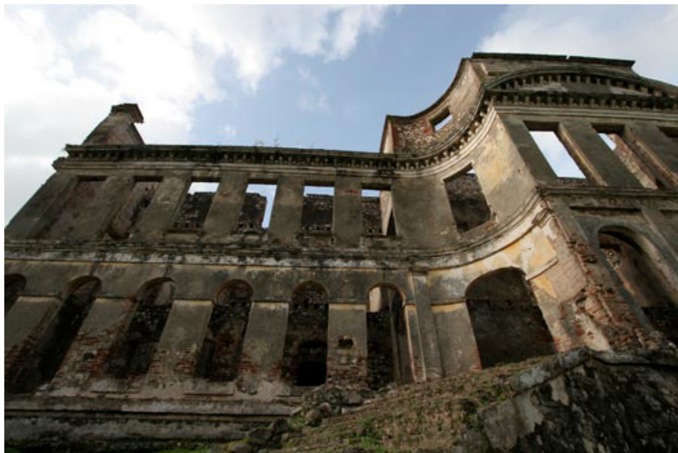
• Détail de la façade sud du Palais de Sans-Souci à Milot, Haïti

Les pertes énormes causés par séisme du 12 janvier 2011 aux biens culturels à Port-au-Prince (Voir le BI-9, 1 er février 2010) incitèrent la Fondasyon Konesans ak Libète (Fondation Connaissance et Liberté - FOKAL) à s'engager dans la lutte pour la sauvegarde de l'incalculable collection des maisons bourgeoises du XIX ème siècle de Port-au-Prince, communément appelée «maisons gingerbread ». En faisant appel à des nombreux experts internationaux dont ceux de la WMF, la FOKAL réalisa un recensement exhaustif des maisons gingerbread de Port-au-Prince tout