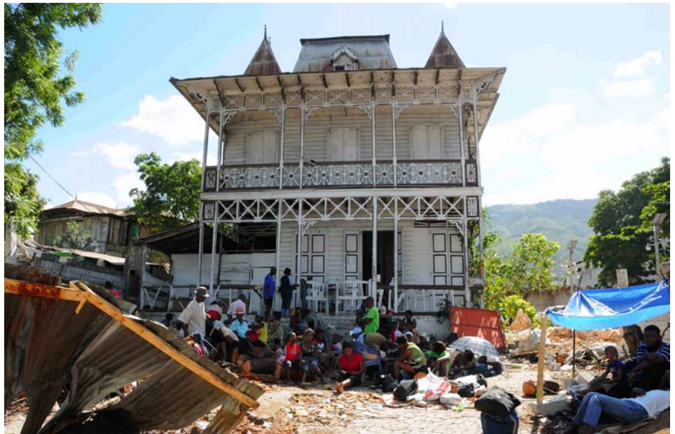
• Une maison gingerbread au quartier du Bois-Verna à Port-au-Prince, le 13 janvier 2010

Edifié au pied de l'impressionnante chaîne du Bonnet-à-l'Évêque, encaissé dans un site grandiose couvert d'une végétation luxuriante, le Palais de Sans-Souci a été conçu comme un vaste complexe administratif servant de fait de capitale au royaume. Le royaume d'Henry I er comprenait toute la partie nord du territoire nouvellement indépendant d'Haïti, convoité tant par la France, l'ancienne métropole de la Colonie de Saint-Domingue, que par la République d'Alexandre Pétion établie dans la partie sud d'Haïti. Le Grand